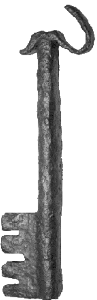
Ovan: Nyckeln. Nedan: Mynt samt värmepåverkad glasbit